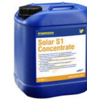
Solar S1 Concentrate