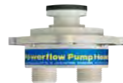
Powerflow Pump Head Adapter