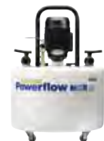
Powerflow Flushing Pump MKIII