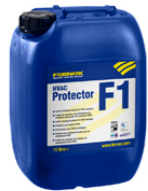
HVAC Protector F1 25 litrov