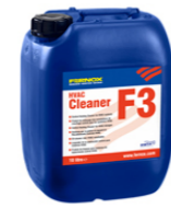
HVAC Cleaner F3 25 litrov